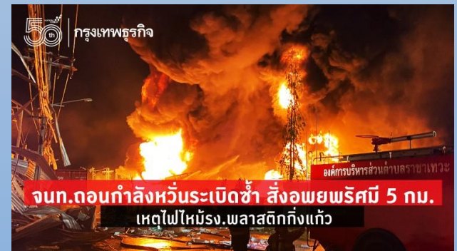
จกท.ถอนกำลังหัวระเบิดซ้ำ สิ่งอภัยพิบัติ 5 กม. เหตุไฟไหม้สง.พลาสติกกิ่งแก้ว

บริษัท หมิงตี้ เคมีคอล จำกัด ซอยกิ่งแก้ว จ.สมุทรปราการ